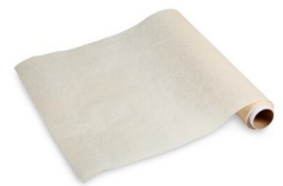
کاغذ و اکس‌دار