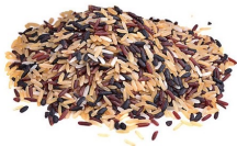
نان، کیک و غلات