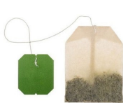
چای کیسه‌ای (منگه‌های فلزی را بردارید)