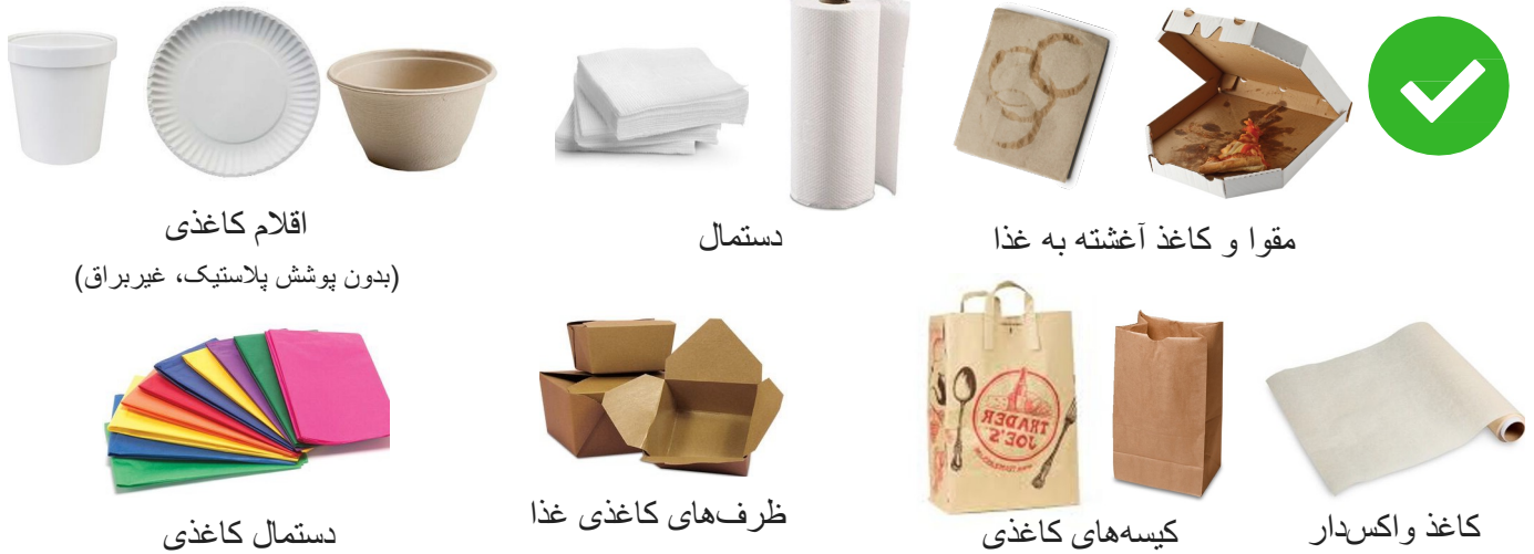
اقلام کاغذی (بدون پوشش پلاستیک، غیربراق)