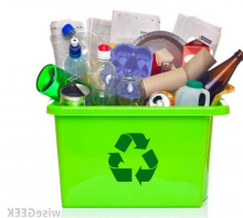
اقلام باز یافتی