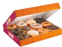
مقوا/کاغذ آغشته به غذا دارای پوشش پلاستیک