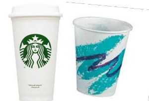
لیوان‌های دارای پوشش پلاستیک