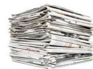
روزنامه و ضمیمه‌ها