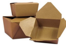
ظرفهای کاغذی غذا (بدون پوشش پلاستیک، غیربراق)