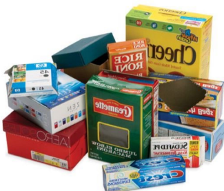
مقوای دارای پوشش پلاستیک (تمیز)