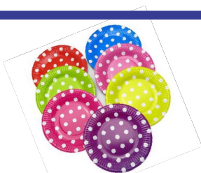
اقلام کاغذی دارای پوشش پلاستیک

**اقلام کمپوست با لوگوی « قابل کمپوست» روی آن**