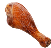
گوشت و استخوان