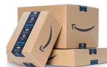
جعبه‌های حمل و نقل