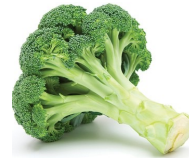
میوه‌ها و سبزیجات