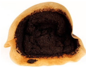
تفاله و فیلتر قهوه

این اقلام را می‌توانید در حیاط خودتان نیز کمپوست کنید. روش آن را در اینجا ببینید fairfaxva.gov/composting