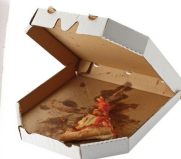
کاغذ آغشته به غذا