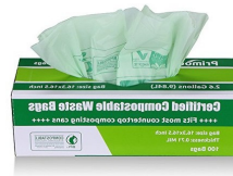
*کیسه‌ها/محصولات قابل کمپوست تایید شده