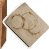
کیسه‌ها و بشقاب‌های کاغذی (بدون پوشش پلاستیک، پوشش واکس اشکالی ندارد)